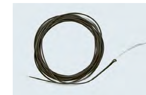
Sinktipp mit Tungstenaustaub zur Beschwerung (Fliegenfischen)