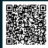
PDF des Flyers

Nicht nur Blei ist für Lebewesen in Gewässern problematisch. Auch Kunststoffe wie Gummi, Angelschnüre und andere synthetische Materialien können schädliche Wirkungen auf Wasserlebewesen haben, sei es durch Freisetzung problematischer Stoffe oder infolge ihrer Aufnahme mit der Nahrung. Deshalb ist auch darauf zu achten, dass diese Materialien nicht in die Umwelt gelangen. Die Natur dankt's!